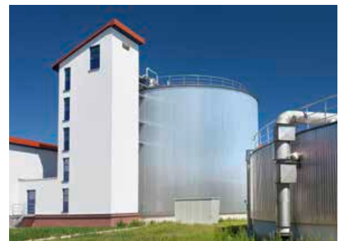
Biogas aus Klärschlammfäulung wird in zwei Blockheizkraftwerken zur Energieerzeugung genutzt.