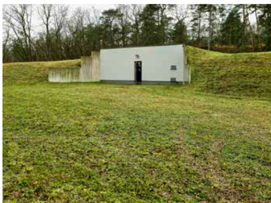
Grüner Hügel mit Tiefgang: Im Hochbehälter Gallun lagern 11.000 Kubikmeter Wasser in unterirdischen Kammern.

W asser ist unser Lebensmittel Nummer eins. Ohne Flüssigkeit kann unser Körper nicht funktionieren. Wasser fördert etwa den Transport von Mineralstoffen, beseitigt Abbauprodukte und reguliert die Körpertemperatur. Damit ist Wasser neben Sauerstoff das wichtigste Element für den menschlichen Körper. Zudem brauchen wir Wasser in Haushalt, Landwirtschaft, Gewerbe und Industrie. Jeder Wittenberger verbraucht durchschnittlich 130 Liter H 2 O, und zwar täglich. Damit liegt die Lutherstadt rund zehn Liter über dem Bundesdurchschnitt. „Bedingt vor allem durch die Gartenwasserzähler, die sich in unserem Versorgungsgebiet großer Beliebtheit erfreuen und mit denen sich die Abwassergebühr einsparen lässt“, sagt Magdalena Schülert, Abteilungsleiterin Gas- und Wasserversorgung bei den Stadtwerken. Seit 1994 versorgen die Stadtwerke Lutherstadt Wittenberg die Stadt mit dem kühlen Nass. „Unser