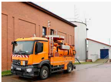
Das Kanalspülfahrzeug des Entwässerungsbetriebes dient der Reinigung der Abwasserkanäle.